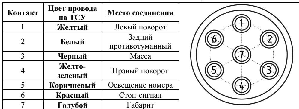
СХЕМА МОНТАЖА ТСУ