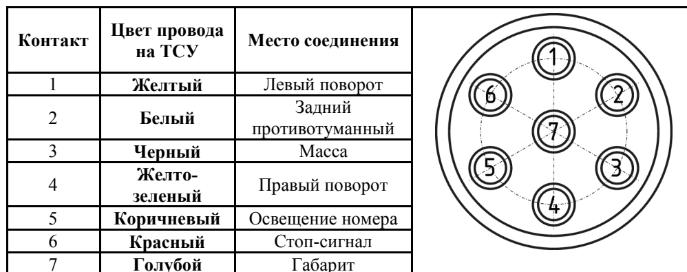
СХЕМА МОНТАЖА ТСУ