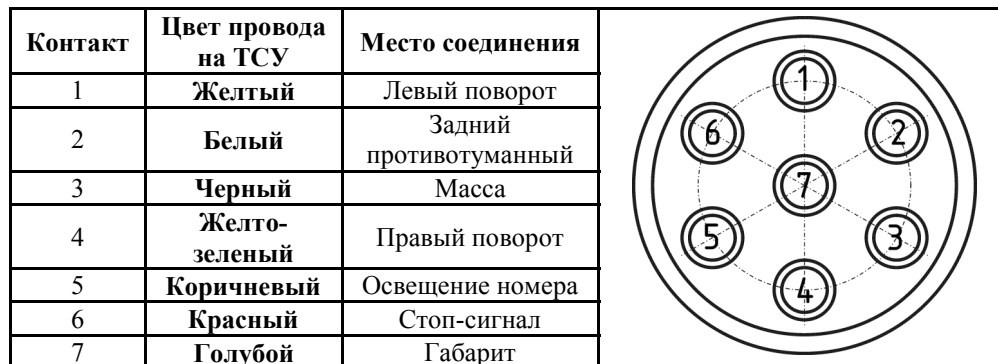
СХЕМА МОНТАЖА ТСУ